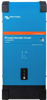
Инвертор Phoenix Inverter Smart 12/2000