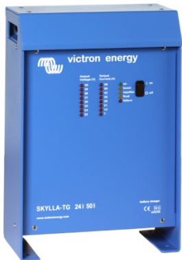
Зарядное устройство Skylla 24 В 50 А