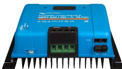
Контроллер заряда SmartSolar MPPT 250/100-Tr VE.Can без экрана