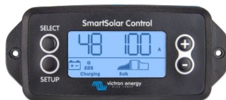
Подключаемый экран SmartSolar

Просто снимите резиновую заглушку, которая закрывает разъем спереди контроллера и вставьте кабель монитора.