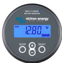
Bluetooth-датчик: BMV-712 Smart Battery Monitor