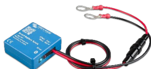
Bluetooth-датчик: Smart Battery Sense