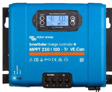
Контроллер заряда SmartSolar MPPT 250/100-Tr VE.Can с опциональным подключаемым экраном